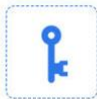
Clé mécanique de secours